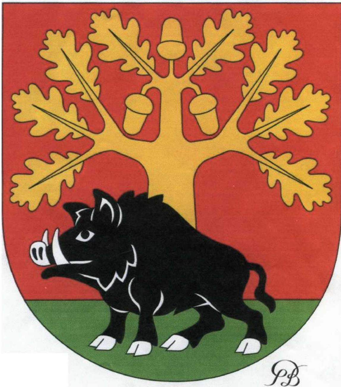
herb gminy Stężyca

Załącznik nr 1 do Uchwały Nr XLIV/256/2006 Rad Gminy Stężyca z dnia 11 października 2006 r